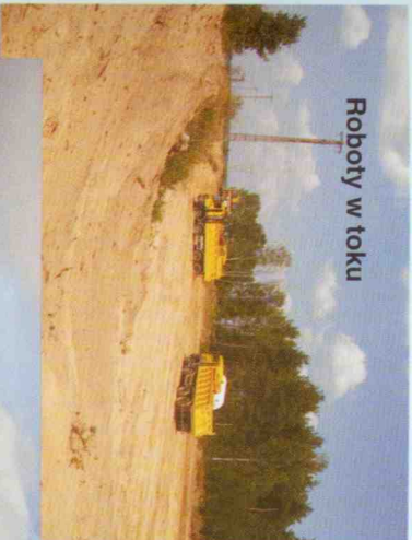
Roboty w toku

Inwestycja jest niezwykle ważna pod względem ekonomicznym, gospodarczym i społecznym, zarówno w kontekście regionalnym jak i w skali makroregionu.